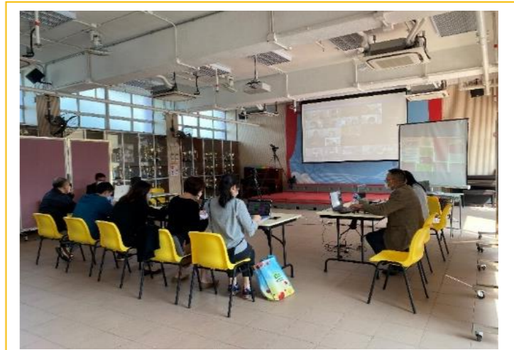
國民學校設備完善，網絡流暢清晰，各位校長及老師在線上、線下熱烈地交流