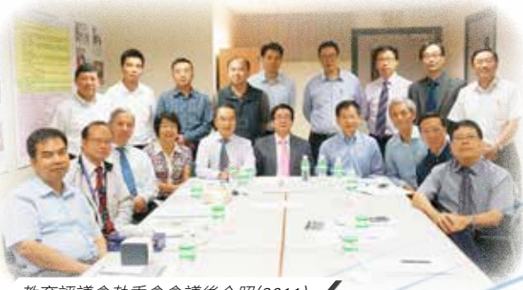
教育評議會執委會會議後合照(2011)