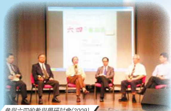
參與六四的教與學研討會(2009)