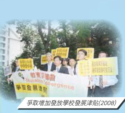
爭取增加發放學校發展津貼(2008)