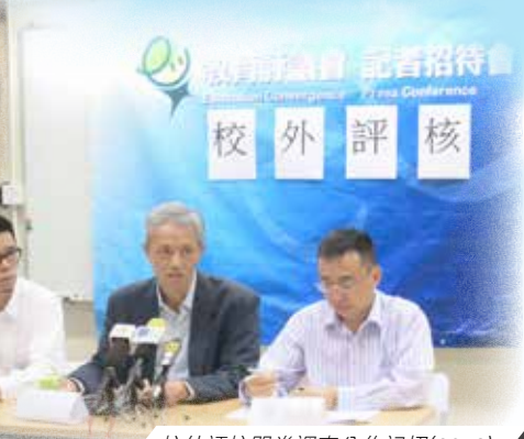
校外評核問卷調查公佈記招(2013)