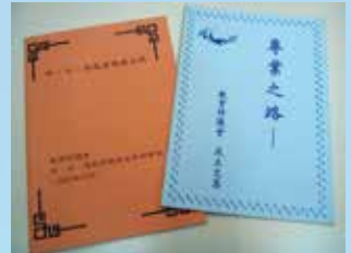
專業之路文集及本會初期出版物