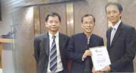
週年大會暨主題講座(2014)