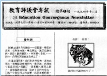
教評會訊創刊號首頁複印本