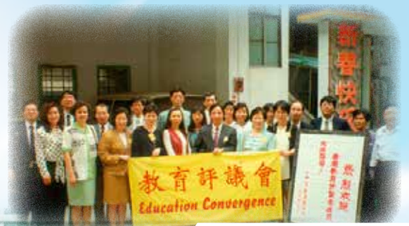
第一次組團廣州考察交流(1995)