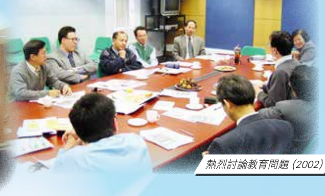
熱烈討論教育問題 (2002)