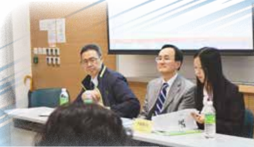
本會主辦新高中課程檢討會(2014)