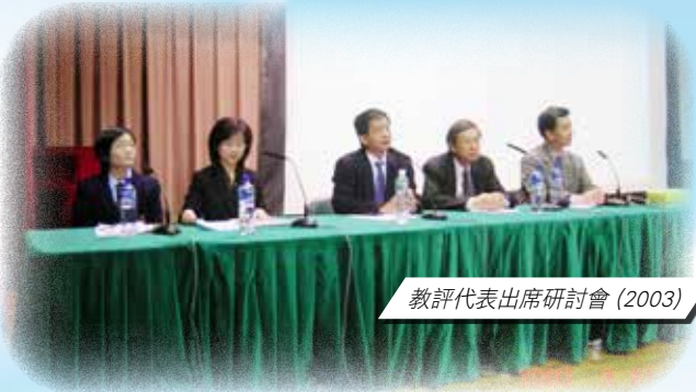
教評代表出席研討會 (2003)