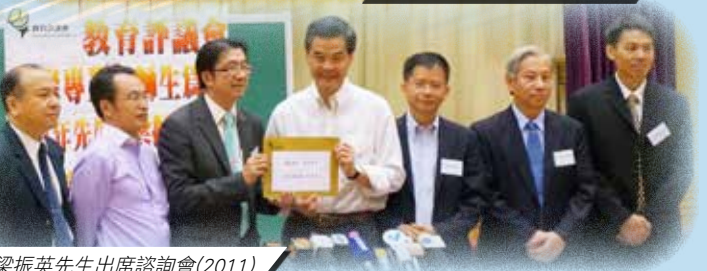
邀請梁振英先生出席諮詢會(2011)