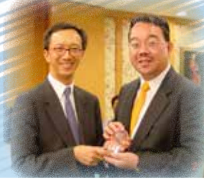
梁錦松為周年大會主講嘉賓(2001)