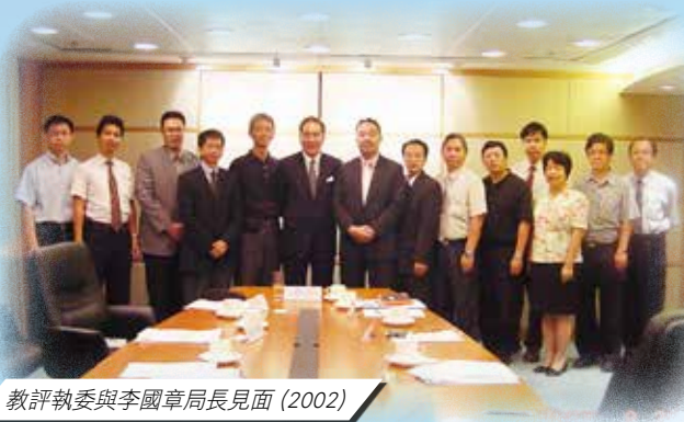
教評執委與李國章局長見面 (2002)