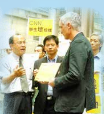
抗議CNN主播辱華言論(2008)