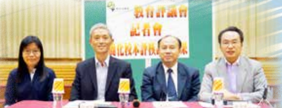
簡化校本評核記者會(2011)