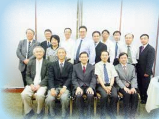
執委與教院校長張炳良教授會面(2008)