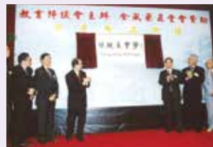
2002年本校命名禮由教育署署長張建宗主禮