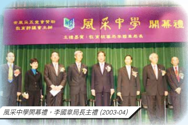
風采中學開幕禮，李國章局長主禮 (2003-04)