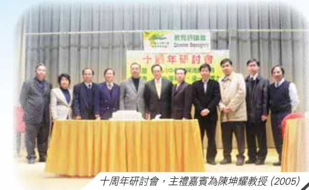
十周年研討會，主禮嘉賓為陳坤耀教授 (2005)