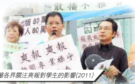
呼籲各界關注爽報對學生的影響(2011)