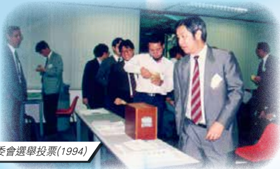
第一屆執委會選舉投票(1994)