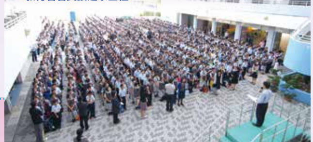
每天延續無鐘聲早會的優良傳統

風采中學在創校校長曹啟樂先生領導下奠定了基業，他於八月底榮休。風采中學以不捨及恭賀之情，並祝賀新任校長何漢權先生接任，傳承風采精神。特於八月三十日舉行「風采12聚會」，嘉賓均是熱心教育人士，有教育局官員、教育界名人、教評會成員及風采中學老師等。是晚活動主題除回顧風采中學發展歷史、曹校長在教育的貢獻，以及何校長的抱負外，當晚現場充滿了在場人士對教育的熱誠和承擔，他們樂於為莘莘學子作出奉獻精神是值得欽佩的。