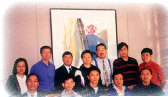
第三屆執委會合照(1998)