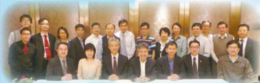
執委及會員與第五任教院校長張仁良教授會面(2013)