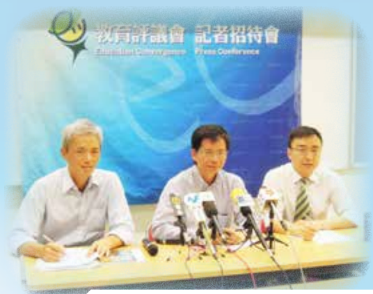
就分析教材及教科書電子化召開記招(2012)