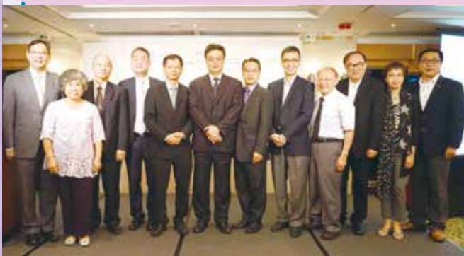
「風采12聚會」上交棒，兩位校長與眾嘉賓合照