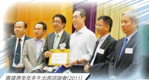
邀請唐英年先生出席諮詢會(2011)