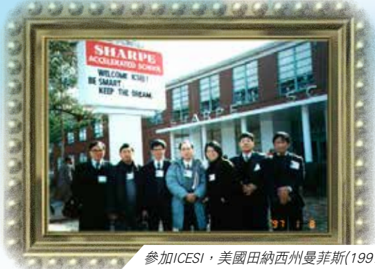
參加ICESI，美國田納西州曼菲斯(1997)