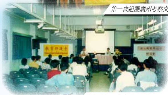
教師培訓：新教師研習課程(1995)