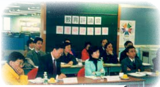
時任教育署署長羅范椒芬出席內部研討會(1999)