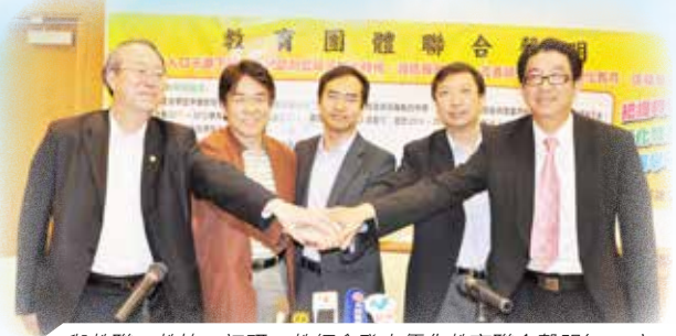
與教聯、教協、初研、教師會發表優化教育聯合聲明(2010)