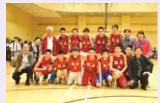
獎項—學界男籃甲組冠軍