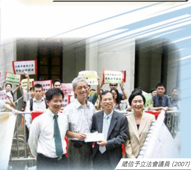
遞信予立法會議員 (2007)