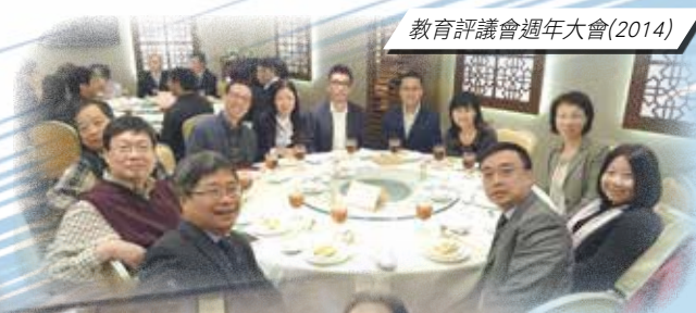
教育評議會週年大會(2014)