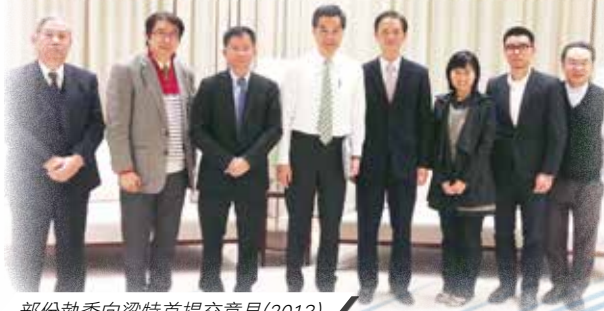
部份執委向梁特首提交意見(2013)