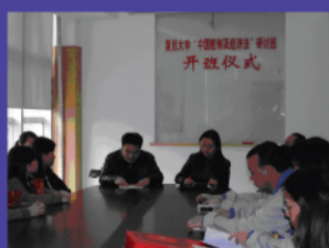
中國商貿及文化交流