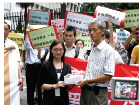
遞交請願信予公務員事務局