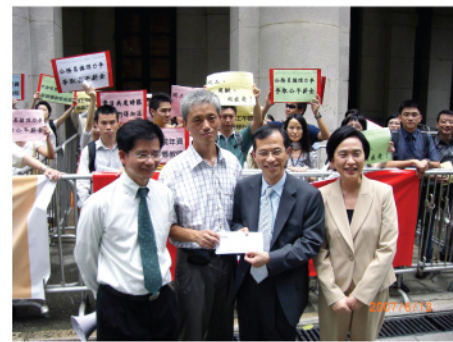
立法會議員接收請願信