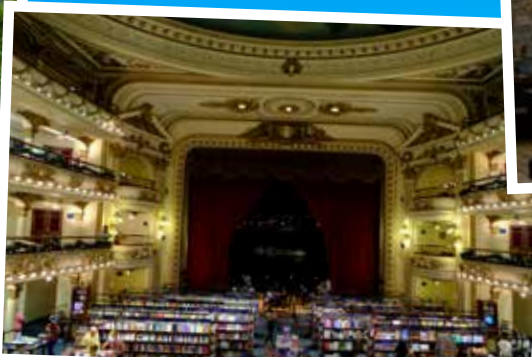
由一所歌劇院改造成的大型書店 (布宜諾斯艾利斯)