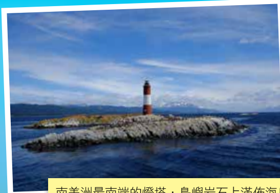
南美洲最南端的燈塔，島嶼岩石上滿佈海鳥