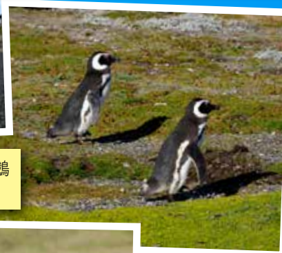
福島有多處企鵝棲息地，同種企鵝自有其「地盤」(Colony)