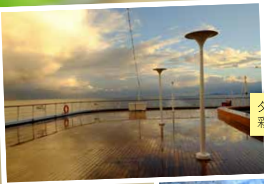
夕陽下的郵船甲板，呈現彩霞倒影，令人陶醉