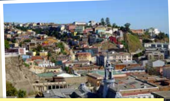
智利海邊有「天堂谷地」之稱的Valparaiso城，山居融合西、英、德三國建築特色，色彩鮮明