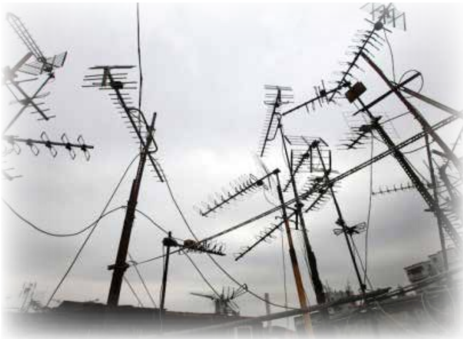
佔領事件平靜下來，是港人反思的良機。

有些港人早兩年講地球村、世界公民，抗拒國家的認同。今天若是同一批人喊港人優先，便會更令我困惑了。說到底，我覺得大家都是一家人，吵鬧一下無所謂，離家出走？非正道也。