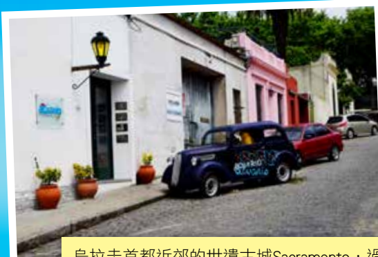
烏拉圭首都近郊的世遺古城Sacramento，過去是葡萄牙殖民地，到處充滿葡國色彩