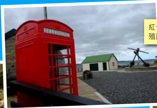
紅色的電話亭 (還有郵箱)，令人想到殖民地時代的香港 (英屬福克蘭群島)