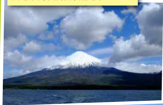
智利Puerto Montt為著名活火山湖區，圖為終年積雪的歐索諾火山