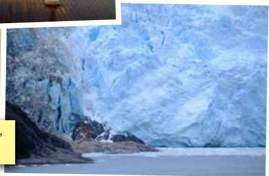
郵輪經南美洲最南端Cape Horn，再北上，沿途多見雪山、冰川