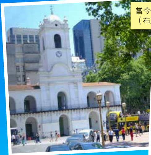
當今教宗聖方濟各在阿根廷的座堂 (布宜諾斯艾利斯)