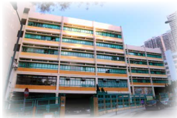
通識科改革要有充足討論，不能一意孤行。