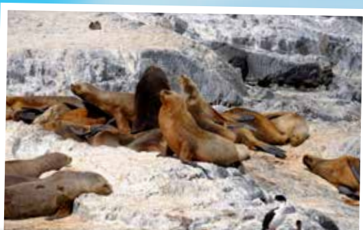
在南美所謂Patagonia地區，海獅等動物並不罕見