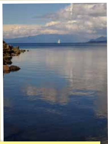
智利最大的天然湖 (基韋湖)，藍天白雪，倒影清澈，視野寬廣