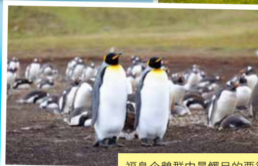
福島企鵝群中最觸目的要算皇帝企鵝了