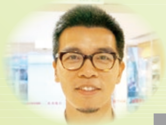
■ 主要執筆：陳偉倫、蔡國光

10.2 恢復教師長期任職(如十年)，可享一年帶薪進修之機會。設立「年輕教師進修獎學金」以獎勵立志教學的年輕教師進修，從而豐富教學人才庫。恢復資助教師買樓支付利息之制度，以及創設為津貼學校教師購置醫療保險之部份費用。藉此吸引優秀的人才擔任教師工作。全世界的文明先進，教育發達的國家或地區、軍人、公務員與教師皆獲社會尊重，並願意給予較高的社會保障，以維繫及推動社會的穩定及進步，香港為何不能？■