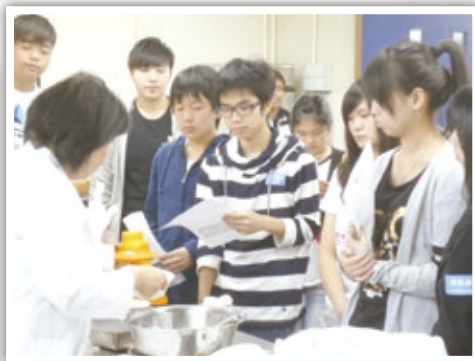
中華基督教會公理高中書院於2013年4月27日為來自各校學生在其真實工場廚房嘗試親手製造小蛋糕及甜品。