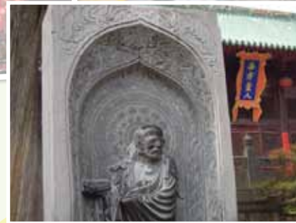
少林寺因達摩祖師傳授佛法而成為禪宗祖庭。