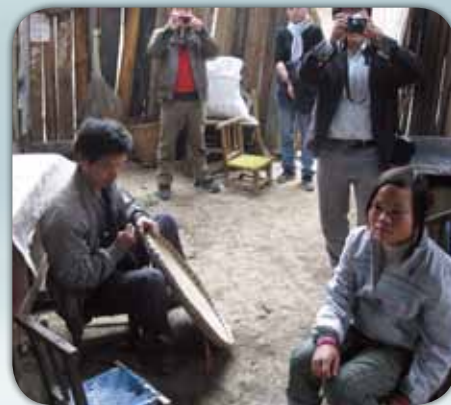
上圖見楊父對來客不聞不問

在驚愕當中，副鎮長急忙道，國家不是沒有給他們建房子，只是建房的材料是國家出，自己也要投入一部份錢，而且還要自己當工人，集合村裡的親友才可合力建成。楊父是個弱智人士，楊母也是個殘，別人蓋屋時，他們幫不上忙，所以自家建屋，別人也不會來幫，所以房子就建不成。