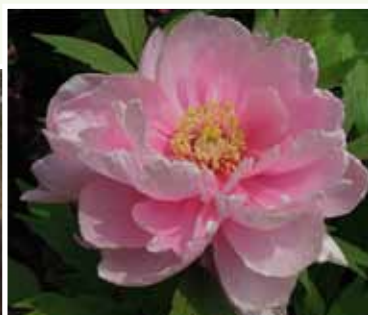
牡丹，花之富貴者也。