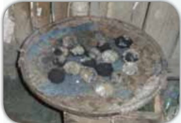
貴州人愛吃的糯米糍粑，燒焦黑了，而且發霉，放在屋角。

第二次訪問時和楊母（中穿淺藍衣服者）她不會說漢語，只能說少數民族的布衣語，但表達力甚有問題，問及楊父時，她胡亂以對，領導聽到睡在床上的人是舅舅，但後來更正父親臥病在床。