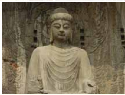
龍門石窟奉先寺佛像，傳說是按武則天相貌造像。