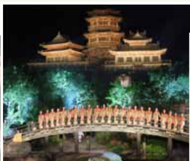
名為禪宗少林，音樂大典的演出，由譚盾、永信方文、易中天等策劃。