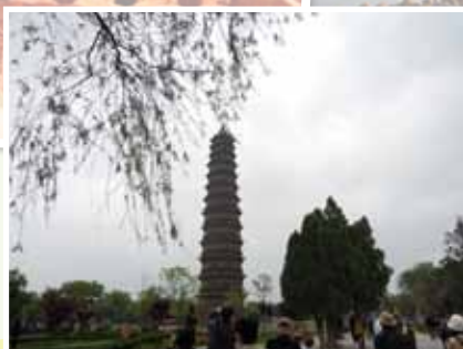
開封鐵塔，實為褐色琉璃磚建成，已有近千年歷史。