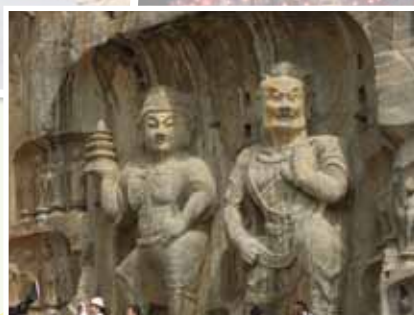
奉天寺盧舍那佛旁的天王和力士，造形逼真。