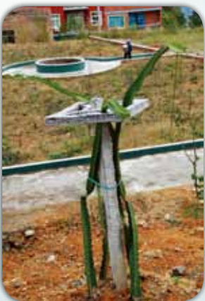
火龍果的外貌似仙人掌，是仙人掌屬植物

紅水鎮中心校建得美輪美奐，背山面湖，環境絕佳，是一所完善得無可挑剔的校舍，宿舍和食堂齊備，學生享受國家九年義務教育，應該是一個學習的好所在。