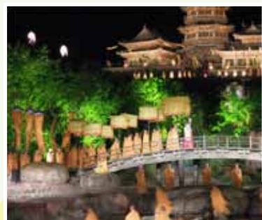
以嵩山作現場背景的大型表演。