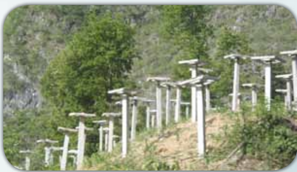
羅甸縣很多地方都已大量種植火龍果

貴州南部地處亞熱帶，新興在斜坡上種植一種個頭甚小——聞說和人的大姆指差不多大小的紅色火龍果，價錢最低十多元一斤（10兩500克），而且十分暢銷，供不應求。