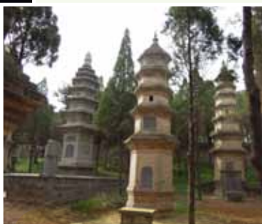
少林寺塔林，現存唐代至今二百多座，是安葬歷代高僧的地方。