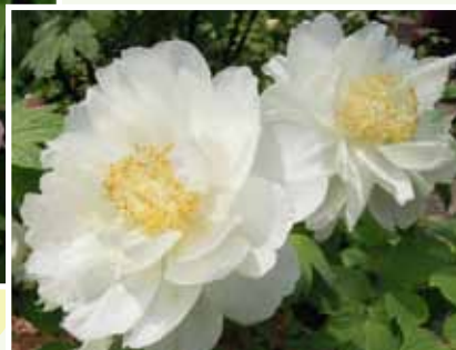
牡丹色多，白色則另顯素雅一面。