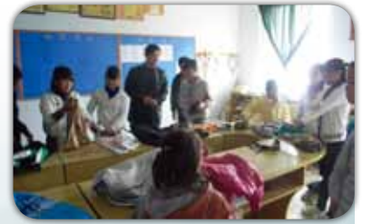
舊衣服不受學生歡迎

人們雖然貧窮，但也不致於買不起衣服，時代變了，尤其是年輕一代，喜愛新，喜愛新鮮事物，舊衣服全然不受歡迎，這個觀念上的轉變，相信很多人也不知道。